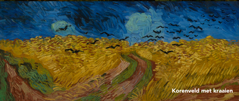
Korenveld met kraaien