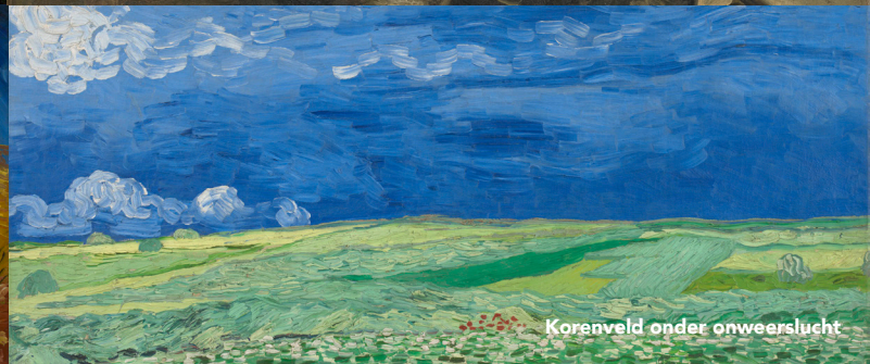
Korenveld onder onweerslucht