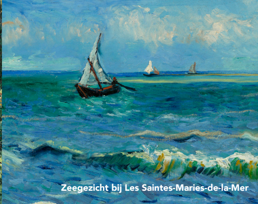
Zeegezicht bij Les Saintes-Maries-de-la-Mer