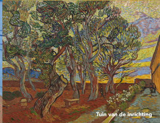
Tuin van de inrichting