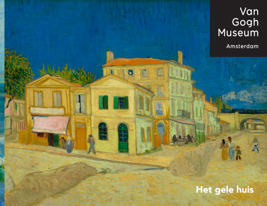
Het gele huis