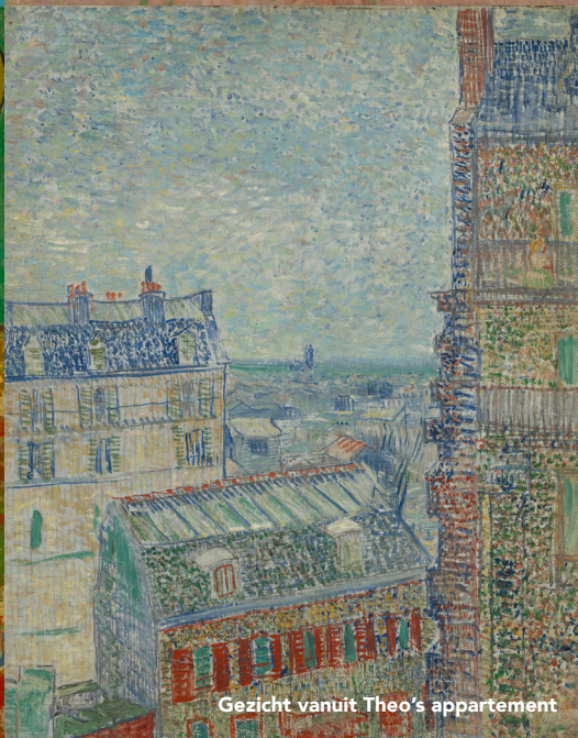
Gezicht vanuit Theo's appartement