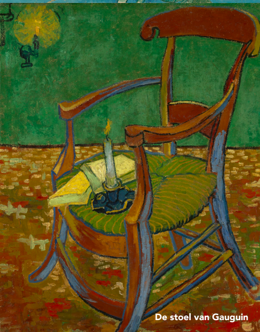
De stoel van Gauguin